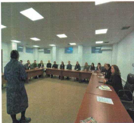
Foto nga punëtorja me temë “Integrimi në treg, zinxhiri i vlerës dhe ndërmarrësi”,

Ky aktivitet shërbeu si një platformë e rëndësishme për të diskutuar sfidat dhe mundësitë e grave në tregun e punës, për të shkëmbyer përvoja dhe ide, si dhe për të promovuar iniciativa të reja sipërmarrëse që kontribuojnë në integrimin ekonomik dhe fuqizimin e rolit të grave në shoqëri.